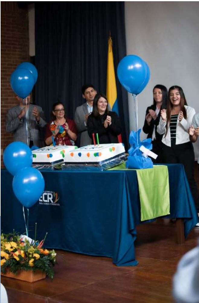
¡#FelizCumpleECR! El pasado 29 de agosto, nuestra Institución cumplió 66 años de vida al servicio del país, la academia y su entorno social.